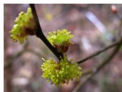
ダンコウバイの花・二十九日