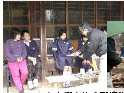
上之郷小生の環境学習