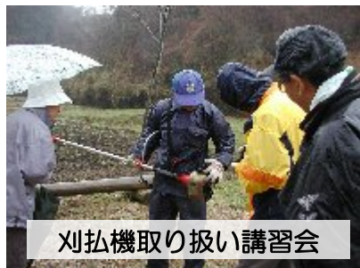
刈払機取り扱い講習会