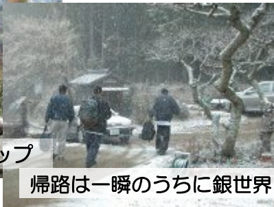
帰路は一瞬のうちに銀世界