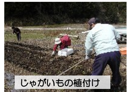
じゃがいもの植付け