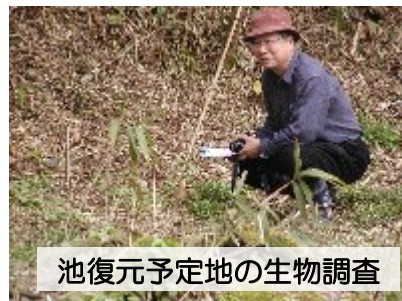
池復元予定地の生物調査