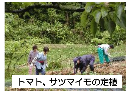
トマト、サツマイモの定植