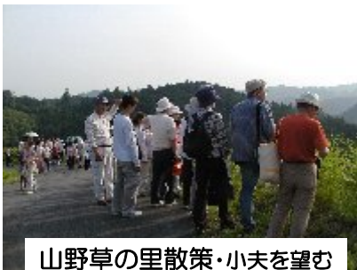
山野草の里散策・小夫を望む