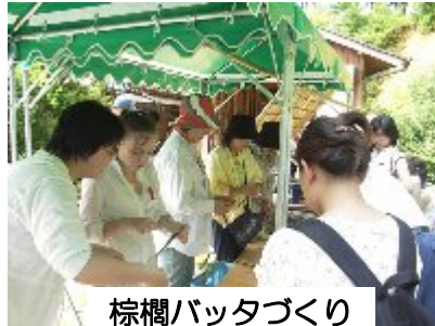
棕櫚バッタづくり