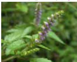
ナギナタコウジュ