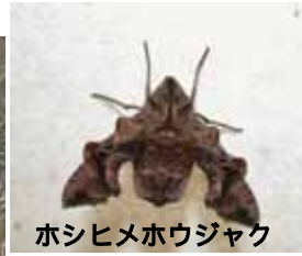
ホシヒメホウジャク