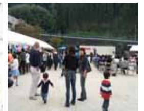
よみうり天満橋のみなさん 鎮守の森のみなさん