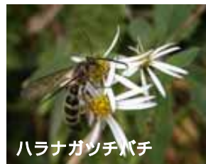
ハラナガツチバチ