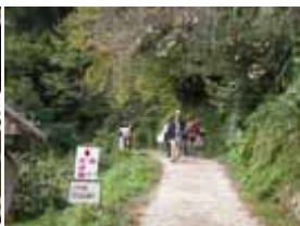
赤いそば園への道

キッズ自然体験 (収穫の喜び) 芋掘りと焼き芋 ピーナツ掘りと湯がき (子ども探検基地) はしご作り プランコ遊び ターザン遊び 丸木橋わたり 虫取り