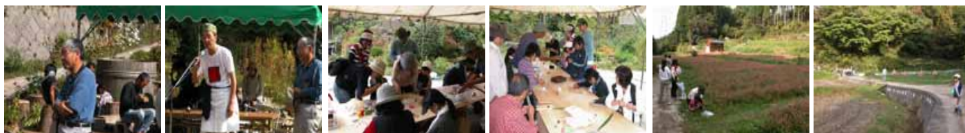
福岡理事長の挨拶 脇屋さんの挨拶 クラフト(1) クラフト(2) 自然探索 そば畑 刈り取り後のススキ

自然探索 1時40分 理事長の家の上を回り、池に下り、そば園周辺を回り、山道と里道を歩きました。刈り取りの終わった田には三谷独特のススキが見られました。道を歩くとバッタやトンボが少なくなり、網を持った子どもたちはちょっと退屈だったかもしれません。主にタデ科の植物とキク科の植物を見ました。