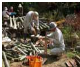
竹食器づくり 切り、割り、油抜き

準備 草引き、そば園の開園、竹食器作り、テント張り、テーブルといす作り、バザー用のジャム作り、ハナナスやハヤトウリの収穫、模擬店のヨシズ張りなどを行い、当日の朝にもテント張り、模擬店、のぼり立て、駐車場案内設置、拡声装置、テーブルといすの配置、竹食器洗い、ガスコンロ、おにぎりと副食づくり、そばの薬味などきりきり舞いでした。一番のバスを向かえる前からお客様が来られ、じょじょにお祭り気分となりました。