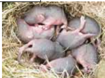
上 そばの刈り取り中に見つかったカヤネズミの巣に7匹の子もたち そと草の中に戻したら三日後に空っぽになっていました。無事移転したものと祈っています。