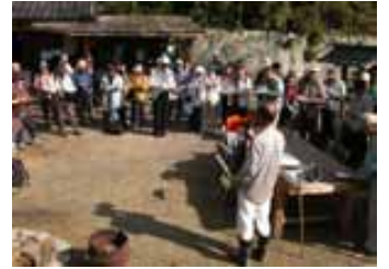
5日 ウォーキングフェスティバル 12日 福岡理事長の講演の様子 13日 シニア自然大学