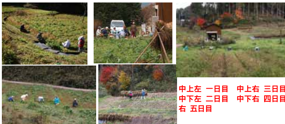
中上左 一日目 中上右 三日目 中下左 二日目 中下右 四日目 右 五日目

そのほかの活動は、そば畑の草刈り、藍の葉の脱穀、サツマイモ、ピーナッツ、ハナナス、唐辛子、小芋などの収穫、ガマズミの実取り、古代米の脱穀、脱穀機の整備、倒れたテントの補修などもありました。