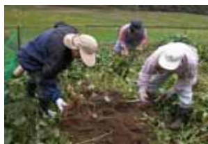
4日 ムラサキイモ掘り

23日に予定の奈良県児童館協議会交流会の訪問は天候が思わしくなく、今回は中止になりました。