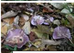
左から ムラサキシメジ アミガサタケ 埃を飛ばすホコリタケ