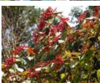
左上 フユイチゴの実 左下 ミヤコアザミ 上 ガマズミの実