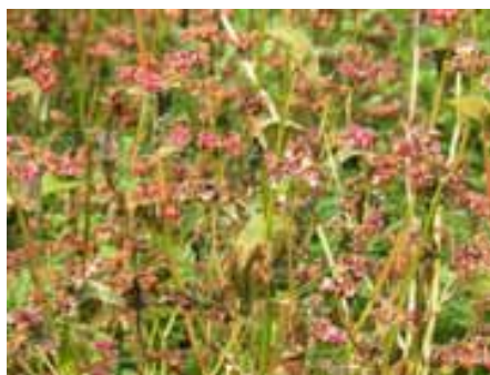
11月11日のそばの様子

8日の活動日の朝、赤い花のそばに初霜が降りました。そばの生育状態を見るとほぼ上から下までたくさんの実をつけているのに、黒さを増したものはまだまだ少なく、刈り取るにはもう少し日にちがいるように思えました。最初の刈り取りは15日で、黒い実も多く見られましたが、多くは倒れてハコベなどの草に覆われ、昨年に増して難しい作業となり、18日、22日、25日さらに29日までかかってしまいました。