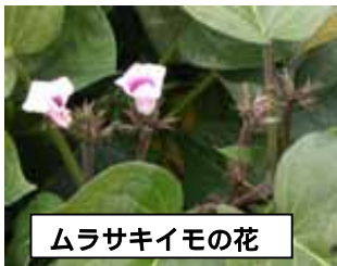
ムラサキイモの花