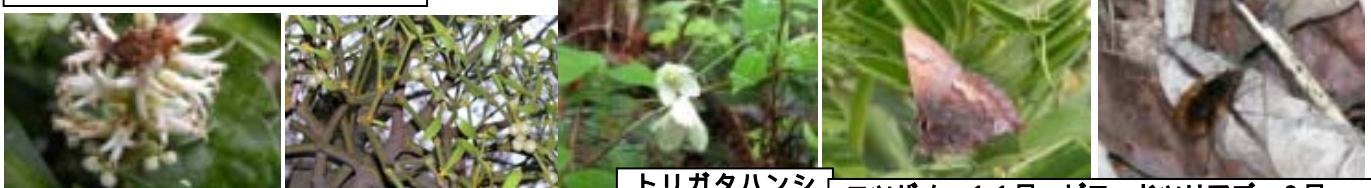
フッキソウ 下に雌花 桜に付いたヤドリギに実 7日