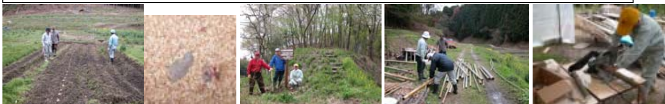
7日 5種類のジャガイモの植え付け 28日 里山林機能回復整備事業の看板立て 18日 竹の準備 28日 薄板切り