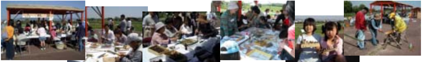
正面風景と自然クラフト 竹のぐい飲み? シュロバッタ 竹薄切りでバンブーアート こんなのできた! 丸太を上手に切る

平城宮の真ん中の「羽ばたく朱雀エリア」に72本の朱塗りの柱列が二本、その間に染染め白布による朱雀大路のイメージが作られています。六つの赤い小屋がけの一つに「山野草」の看板をすえつけました。昨年12月の大神神社のなら結び会では一つのテーブルで自然クラフトを行いました。その内容を発展させて、大ぶりの竹、桧、杉を持ち込んで、自由に切り・割る体験から、自然クラフト・シュロバッタ、さらにあらたにバンブーアートを加えました。シニア自然大学の仲間の協力を得て、毎日10人以上のスタッフで対応しました。一日目は制限なしにお客様を受け入れましたが、会場が混乱しスタッフが休めないため、二日目は受付時間を制限するなどの対策をしました。連日200人以上の方々に楽しんでいただけたものと思っています。