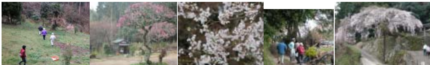
4日 山野草園整備 咲き始めた紅梅に急な春の雪 7日 白木のエドヒガンザクラとお花見 滝倉の権現桜

よい天気にもまれた「花の宴」と月末二日間の「遷都祭クラフト出展」が大きな催しでした。これらの催しの準備と山野草園の整備、桜の山の笹刈り、くろがり、里山林機能回復整備事業の看板立て、山野草自生地の観察と保護柵設置などを行いました。畑の作業はジャガイモの植え付け、古代米の種まき、いちごやエンドウの畑の草引き、エンドウの支柱立てがありました。このほか前月に引き続き間伐した松と杉の運び出しも行いました。7日午後には白木のエドヒガンザクラと滝倉の権現桜などのお花見をしました。