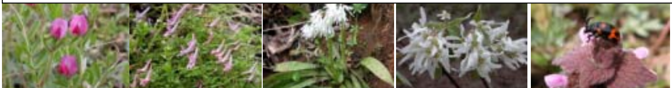
カラスノエンドウ ジロボウエンゴサク シロバナショウジョウバカマ 8日 ザイフリボク 25日 イタドリハムシ 11日