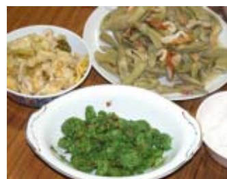
28日の昼食 上 イタドリ 白菜漬物 コゴミ 下 コゴミ ジャガイモ ワサビ タケノコ 卵焼