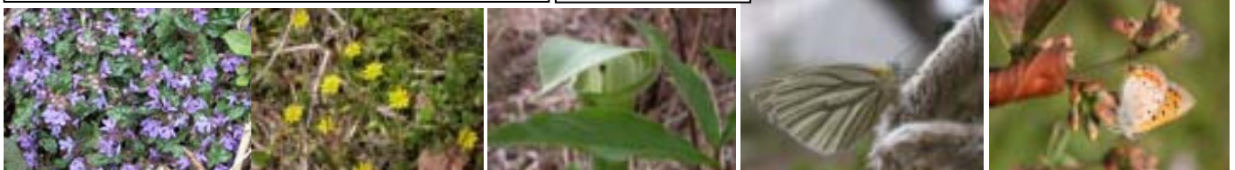
キランソウ 18日 コオニタビラコ 21日 ムロウテンナンショウ 25日 スジグロシロチョウ 18日 ベニシジミ 15日