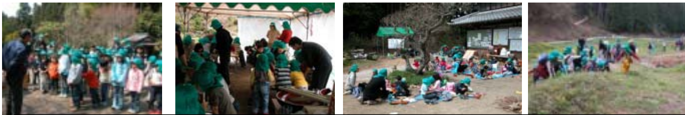
8日 理事長の挨拶 15日 そば打ち開始 持参のお弁当とそばで昼食 池の土手を登る

昨年4月に続いて今年も幼稚園から小学校5年生くらいまでのかわいいお客様がそれぞれ50名近く里を訪問しました。今回は「そば打ち名人になる」がテーマでした。7～8人くらいの6つの班に分かれて、水回し・練り・地のし・本のし・切り・ゆがきまで楽しんで学んでもらいました。8日の水回しでは小さな子どもたちの手に粉がまとわり付いたので、15日は大人の手で最初の水回しをしました。その結果多少余裕があったので、池までみんなで歩いて、タンポポ、ヘビイチゴ、カキドオシ、ジロボウエンゴサクなどの草花を満喫してもらいました。学園では夏の合宿を検討しておられます。