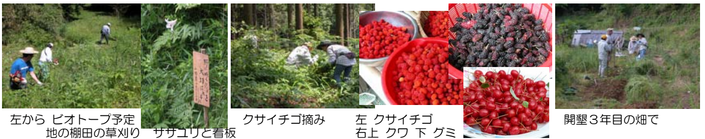
左から ピオトープ予定地の棚田の草刈り

茶摘みの山などのクサイチゴがたくさん実を付けました。2日と6日に6.7kgを摘み取り「野いちごジャム」にしました。20日にはクワの実を1.7kg採り、これもジャムにしました。ボランティアの方からいただいたグミとウメ、畑で採ったイチゴもジャムにしました。竹の子はモウソウチクからハチク続いてマダケを楽しみました。