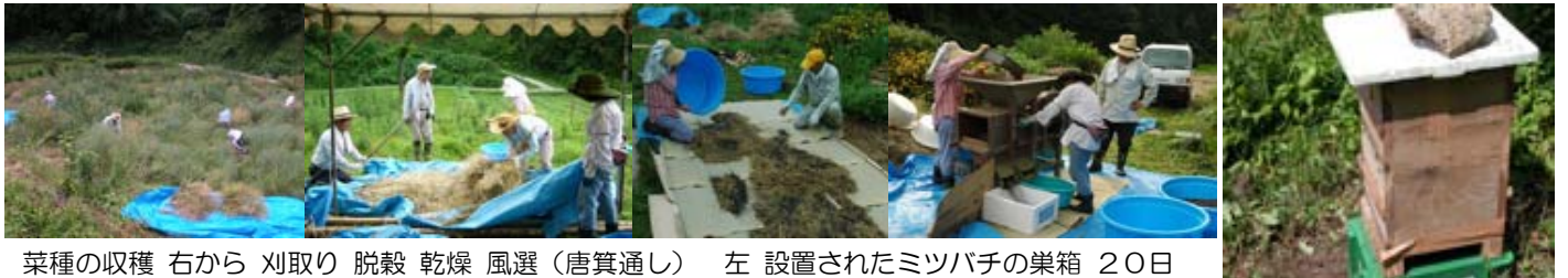
菜種の収穫 右から 刈取り 脱穀 乾燥 風選(唐箕通し) 左 設置されたミツバチの巣箱 20日

「もっと青田刈りが必要!!」と言われながら、花の宴・活動室のリニューアル・天候などで、今年も菜種の刈取り時期を逃してしまい、カワラヒワを喜ばせました。収量は45kgで、昨年より15kgも下回りました。