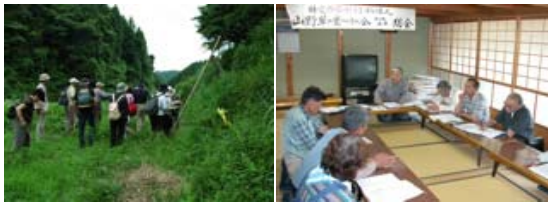
左 ユウスゲ自生地の新現役ネットのみなさん 中 6/23 総会の風景 左 読売新聞奈良版 6/2 スズラン群落の経緯と会の取り組みを紹介。群落の再生と保護のあり方について詳しく報じられました。

27日から工事が始まり、部屋の中の家具や道具を運び出し、テントの下やブルーシートの下に仮置きしました。驚くほど多くの物がありますが、花の宴までには要・不要を見極めてしまいこむ必要があります。