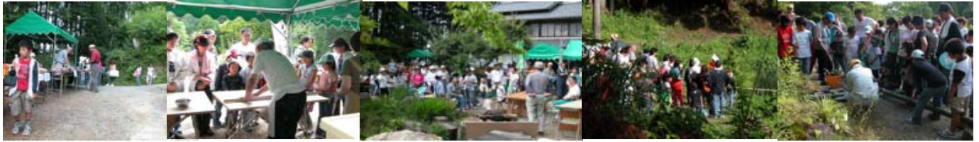
左から 受付とバザー そば打ち 福岡理事長のあいさつ ため池周辺の自然探索 竹灯ろう作り

源平そろった蛸は多くのお客さんに面くらったようです。蛸狩りは禁止でしたが、心無い方がおられ残念です。