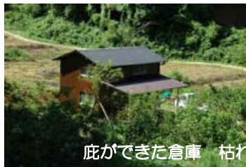
庇ができた倉庫 枯れ草を集めて燃やす 8日

19日、ピオトープ参加者により一畝に種まきをしました。その後二日間にわたり、畝を整形しながら種をまきました。しかし、夏の暑さでよく乾いた畑も、強い雨の出水でいっぺんに湿ってしまい、生えないところが出ました。追加の種まきはなかなかはかどりませんでした。