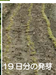
19日分の発芽 種まき 25日