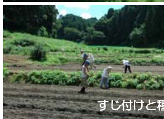
すじ付けと種まき 22日