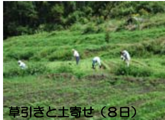
草引きと土寄せ (8日)