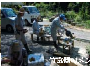
竹食器のメンテ (22日)