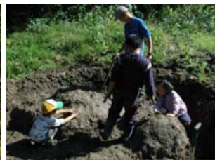
28日 島をべったんべったん 「虫がないかな？」