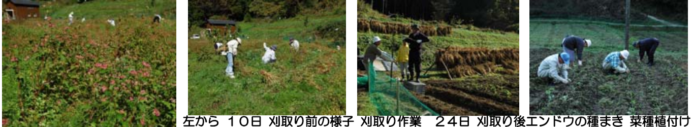
左から 10日 刈取り前の様子 刈取り作業 24日 刈取り後エンドウの種まき 菜种植付け

そばの刈取りは「霜が降りる前に」と、7日、10日、14日、17日、21日に行いました。一番下の畑は日当たりが悪く実りが早い面と遅い面が交錯しているようです。ハキダメギクなどの雑草の妨げもかなりありましたが、しおれる前に大半を刈ることができました。刈取り後直ぐに菜種の植え付けの準備をし植え付けを始めました。昨年までは晩生種のキザキノナタネでしたが、今年から早生種のナナシキブに変わりました。