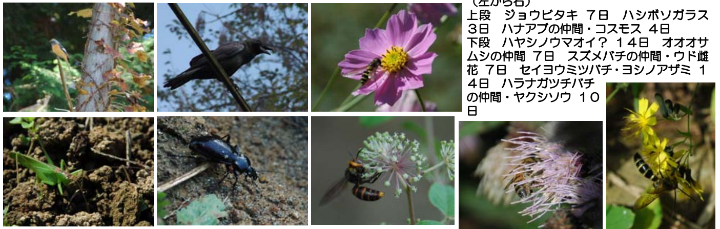
(左から右) 上段 ショウビタキ 7日 ハシボソガラス 3日 ハナアブの仲間・コスモス 4日 下段 ハヤシノウマオイ? 14日 オオオサ ムシの仲間 7日 スズメバチの仲間・ウド雌 花 7日 セイヨウミツバチ・ヨシノアザミ 1 4日 ハラナガツチバチ の仲間・ヤクシソウ 10 日