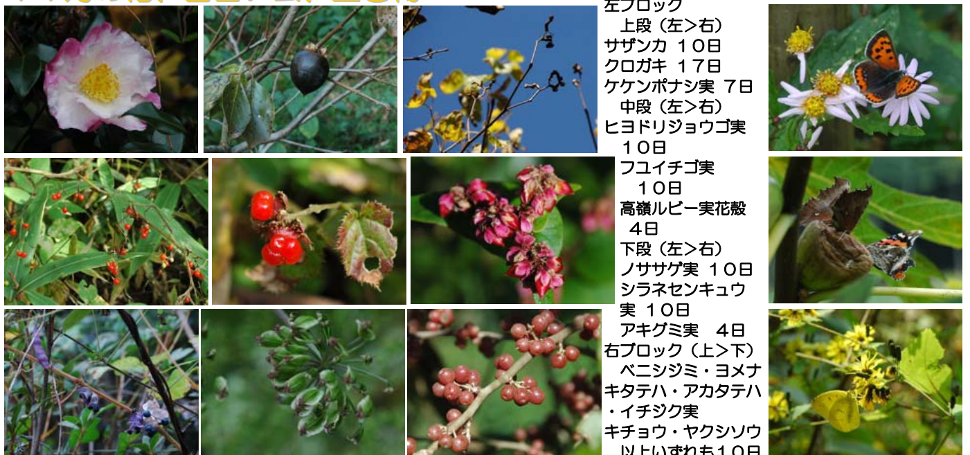
左ブロック 上段（左>右） サザンカ 10日 クロガキ 17日 ケケンボナシ実 7日 中段（左>右） ヒヨドリジョウゴ実 10日 フユイチゴ実 10日 高嶺ルビー実花殻 4日 下段（左>右） ノササゲ実 10日 シラネセンキュウ実 10日 アキグミ実 4日 右ブロック（上>下） ベニシジミ・ヨメナ キタテハ・アカタテハ イチジク実 キチョウ・ヤクシソウ 以上いずれも10日