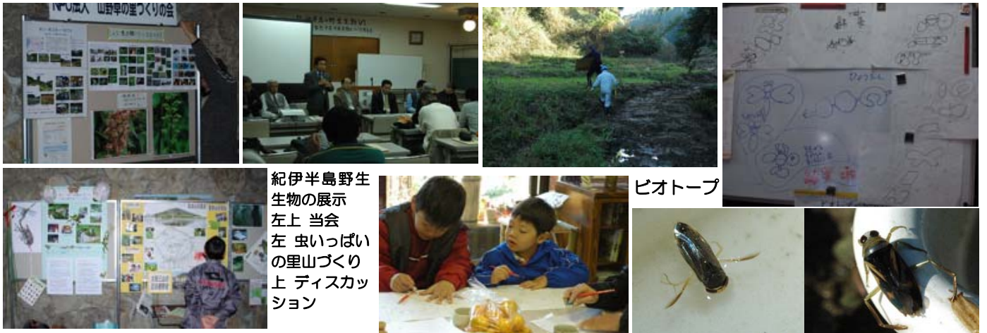
紀伊半島野生生物の展示 左上 当会 左 虫いっばいの里山づくり 上 ディスカッション

3日の活動はみなさん都合が悪く、中止になりました。ピオトープ予定地の小川の整備と、畦道に代わる小川沿いの道作りが16日から始まり、4メートル幅の道ができました。6枚の休耕田も小川沿いの4メートルが道になりました。機械掘り予定の4枚目～6枚目の田の測量を24日に行い、25日にはこの平面図にみんなで池の形を考えて書き込みました。この検討結果に基づいて池を掘り進める予定です。