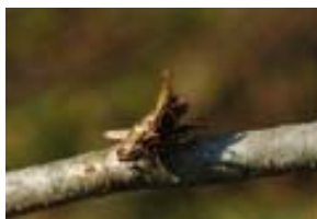
モズのハヤニエになったバッタ 26日