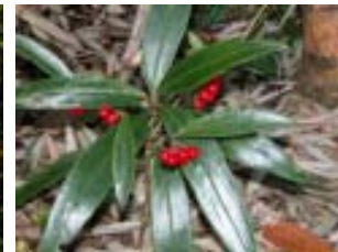
カラタチバナ実 8日