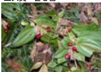
ツルリンドウ実 8日