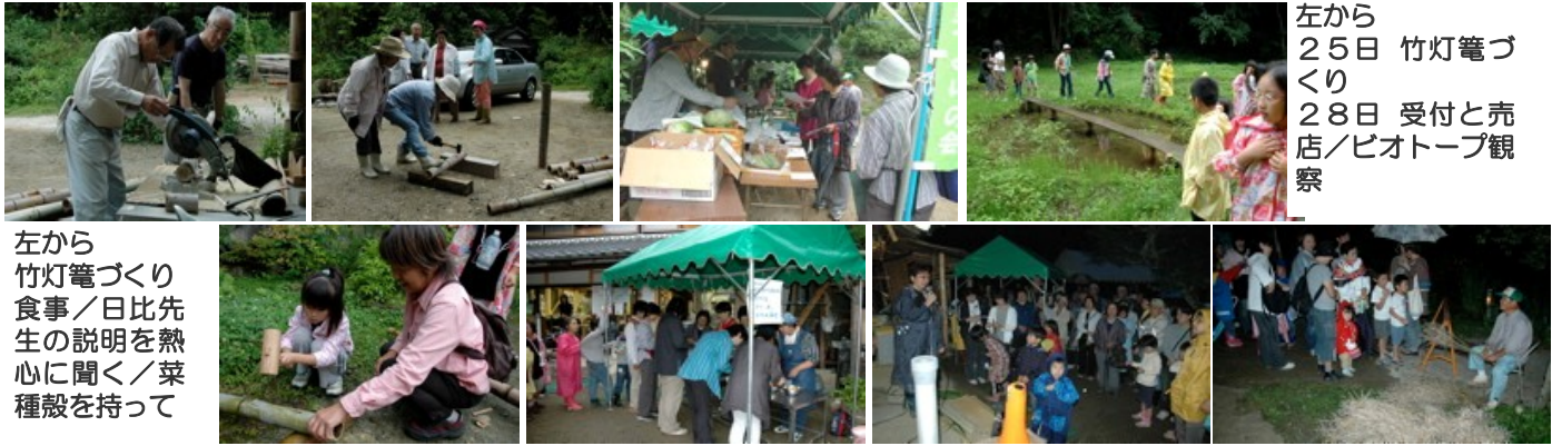
左から 25日 竹灯篋づくり 28日 受付と売店／ピオトープ観察