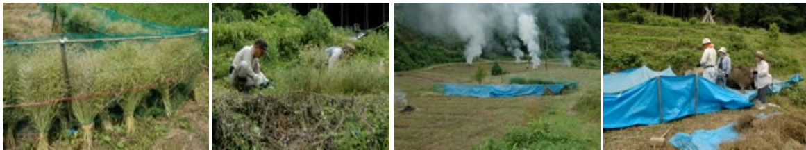
左から 14日 乾燥 18日 刈取り そば畑の草 処理と菜種 の乾燥 25日 脱穀

カワラヒワが連日押し寄せて実を食べるため、まだ実入りが少ないと思われましたが、下の畑を11日に刈取り畑中央の柵に立てかけて、鳥よけのネットを掛けました。16日には、全ての刈取りを行い柵に立てかけて、11日刈取りの一部を脱穀し、雨よけをしました。25日には朝からシートに広げて午後脱穀をしましたが、前日までの雨ではかばかしくなく、残りは屋根の下に取り込みました。収量は今年の半分くらいと思われます。