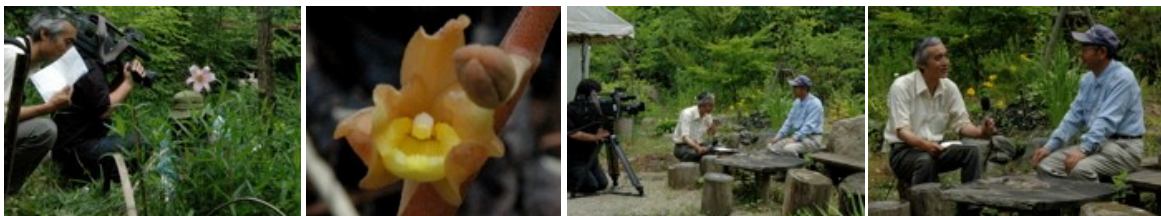
左から ササユリの手入 れの撮影 ツチアケビの花 理事長のインタ ビュー1、2

ササユリの盛りを過ぎた一日、奈良TVの取材がありました。テーマはササユリなどの希少な山野草を「どのように手入れし、増やそうとしているのか」で、実際の笹の刈取りの作業を熱心に撮影され、20日に放映されました。