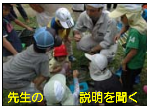
先生の説明を聞く