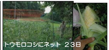
トウモロコシにネット 23日