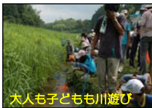
大人も子どもも川遊び