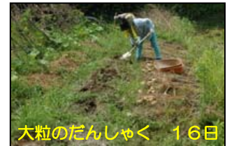
大粒のだんしゃく 16日