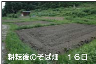
耕耘後のそば畑 16日