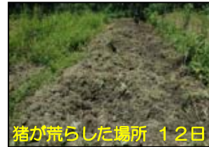
猪が荒らした場所 12日