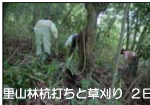
里山林杭打ちと草刈り 2日