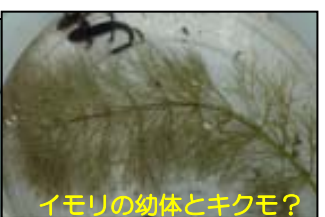
イモリの幼体とキクモ？