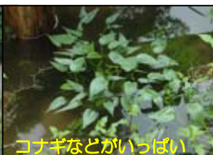
コナギなどがいっぱい