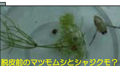
脱皮前のマツモムシとシャジクモ？