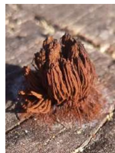
ムラサキホリ (粘菌)