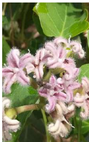
가가 仔 (キウチウ科)

ヤマユリ(ユリ科) イノシシの被害もなく今年は方々のフィールドに見事に開花しました