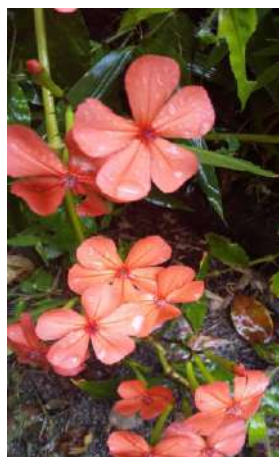
ヲグロセンノウ (テシコ科)