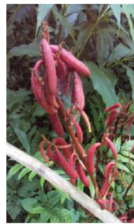
ツチアケビ (ラン科)